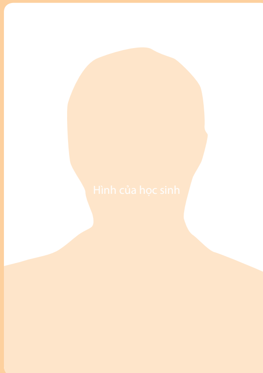
Hình của học sinh

Em tuổi và em chuẩn bị đi học vào năm tới.